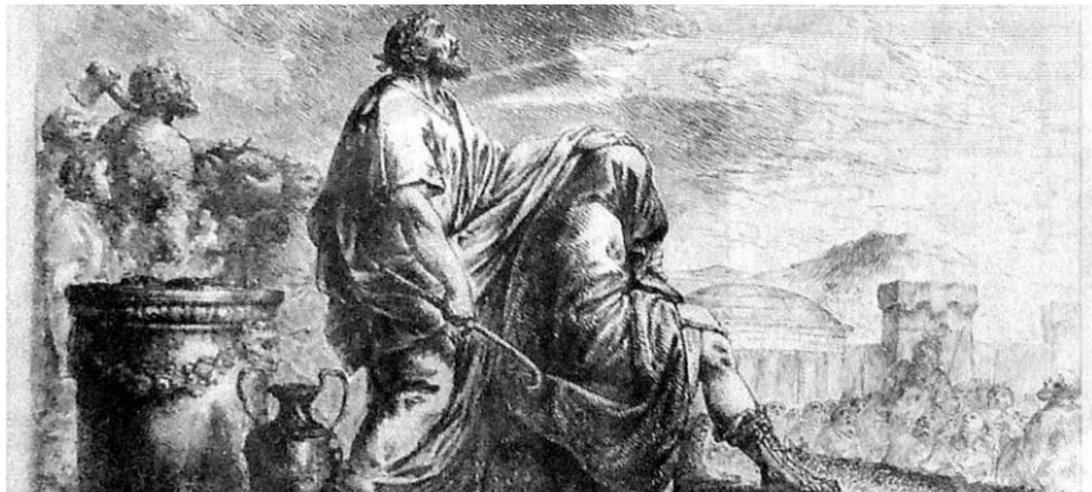
La adivinación y los adivinadores han estado presentes en la historia de la humanidad.

Eromancia, adivinación por medio de aire. Hidromancia: por medio del agua; Cafetomancia: por medio del café; Capnomancia, por medio del