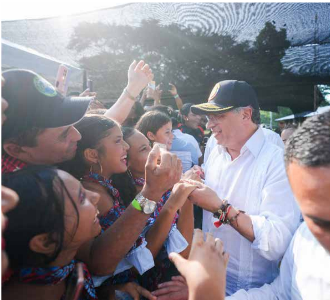
El presidente Petro y la comunidad de Las Pavas.

De acuerdo con la Agencia Nacional de Tierras (ANT), la entrega del predio Las Pavas se convierte en un hito para el Gobierno Nacional, en la medida en que se pone fin a más de 20 años de un proceso agrario que concluye ratificando que, para el Gobierno del Cambio, lo más importante son los campesinos y su reparación integral, a través del restablecimiento de sus derechos.