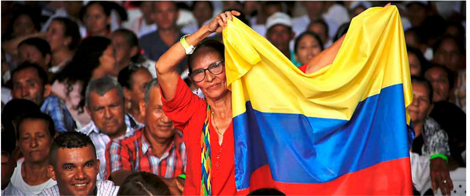
La comunidad de Las Pavas fue merecedora del Premio Nacional de Paz en 2013,

E l Gobierno Nacional entregó ayer jueves 50 resoluciones de adjudicación de los terrenos ubicados en la jurisdicción del municipio de El Peñón, corregimiento de Buenos Aires, y títulos de propiedad de los predios Chipre I y II, y el Provenir, en el corregimiento de Buenos Aires.