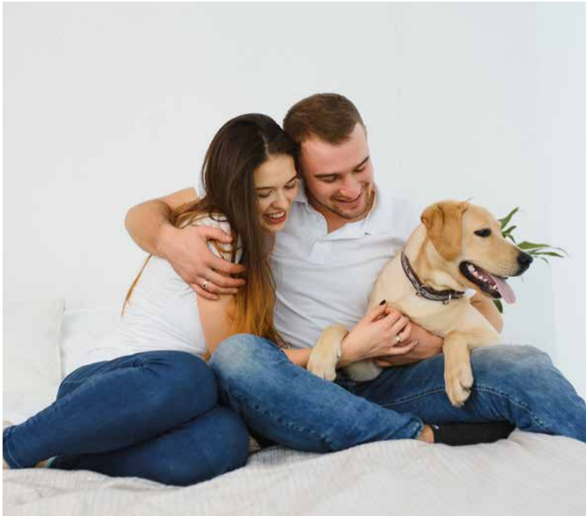
El amor por nuestras mascotas va más allá de compartir momentos en espacios públicos adaptados para ellas. Se trata de entender y respetar sus necesidades naturales, brindándoles un entorno donde puedan ser felices y sentirse seguras.

Actualmente, es común aplaudir a los establecimientos con áreas adaptadas para mascotas. Sin embargo, ¿es esto realmente una muestra de empatía? Consideremos que llevar a nuestras mascotas fuera de su entorno solo para que tengan un plato de comida y un vaso de agua no es necesariamente un acto de amor. El amor verda-