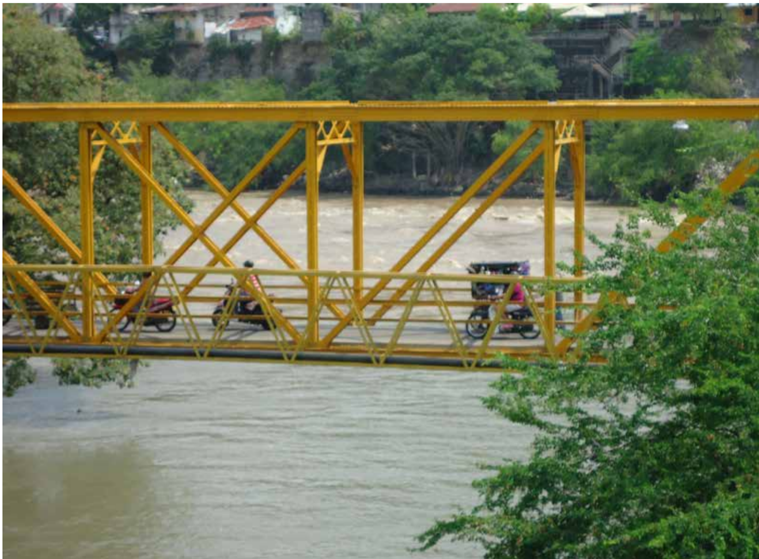
Puente sobre el río Magdalena en Honda Tolima.

De común acuerdo entre las administraciones nacional y departamental, se nombró una junta de ingenieros para estudiar y decidir la vía más apropiada. Después de 16 meses de trabajos, la comisión recomendó la ruta Bogotá – Girardot por la