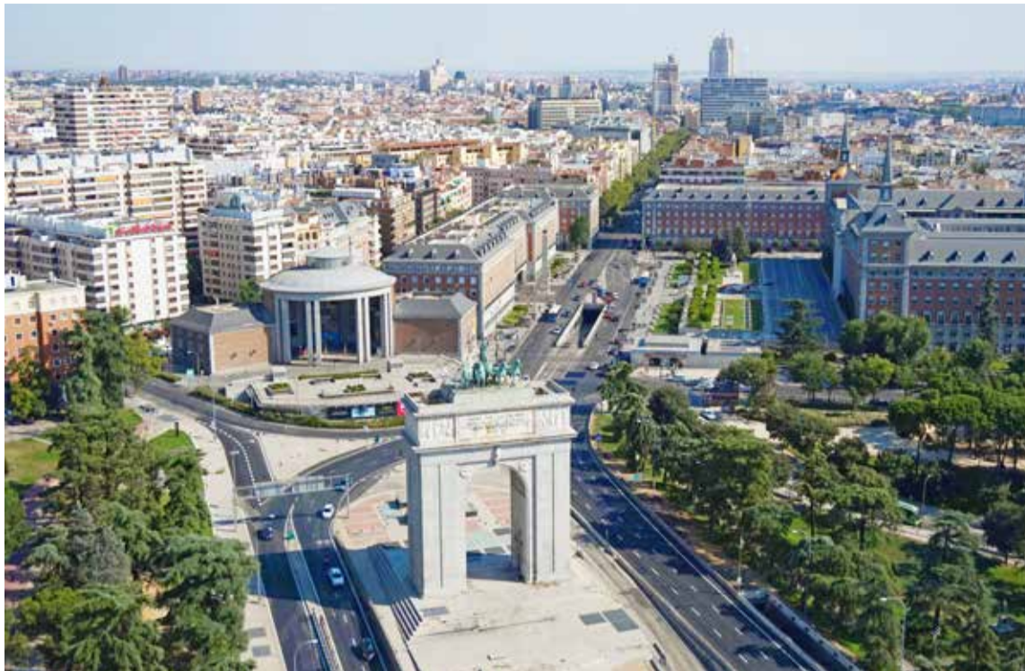
Plaza de Moncloa

Si lo tuyo es más el arte contemporáneo y las vanguardias, Madrid también es tu destino perfecto. No te pierdas los grandes centros culturales como Matadero Madrid, el Centro de