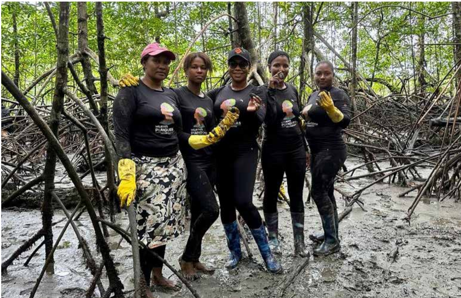
Mujeres Piangueras del Pacífico colombiano

que los convierte en un atractivo gastronómico potencial. A pesar de su importancia en la gastronomía del Pacífico colombiano, el desconocimiento de su potencial nutritivo y la variedad de platos que se pueden preparar limitan su promoción en el mercado gastronómico nacional.