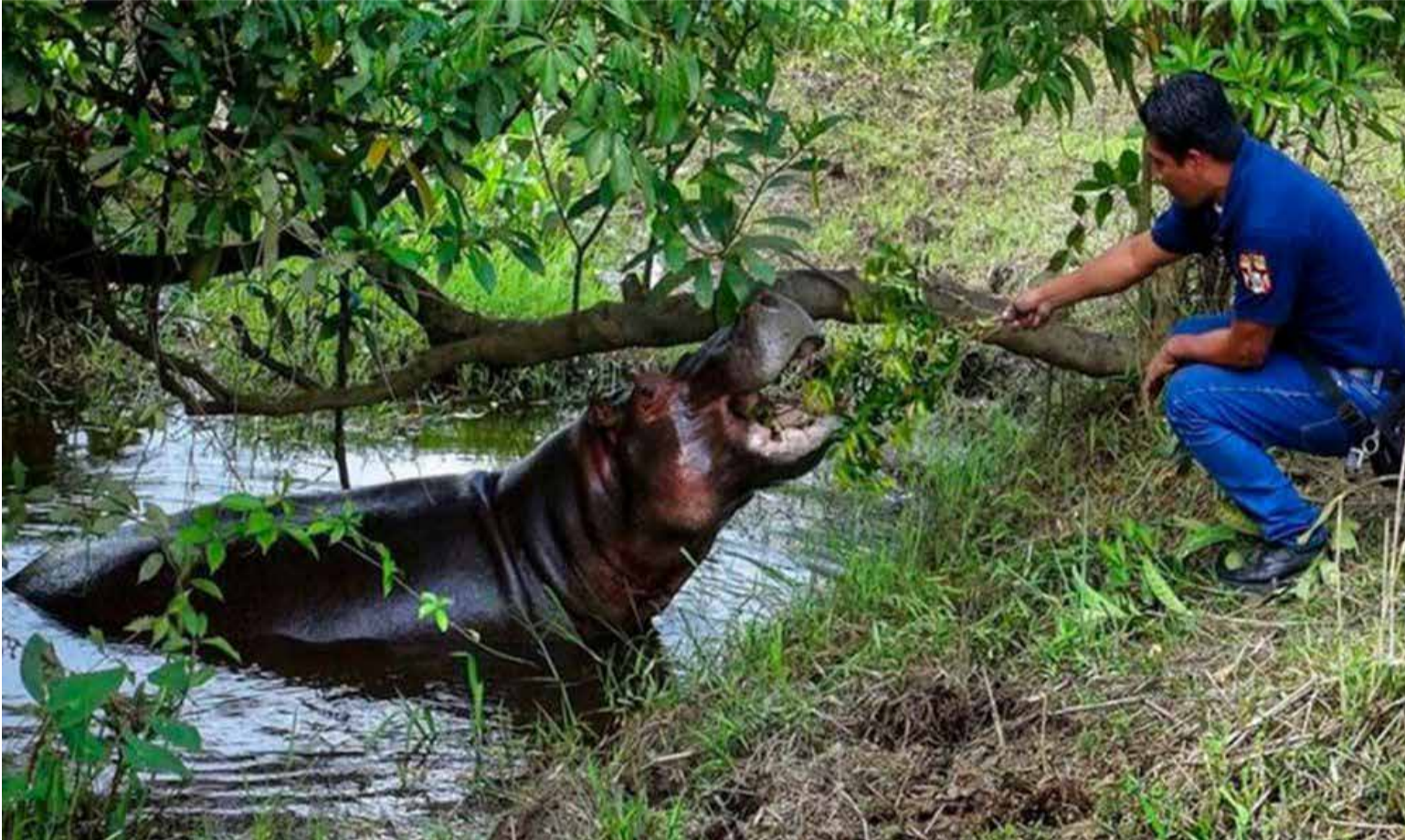
Pepe, es uno de los primeros hipopótamos que trajo a Colombia Pablo Escobar.

sus impactos naturales y socioeconómicos. Al final debe ser la decisión que más convenga a todas las partes y en especial al ecosistema donde los hipopótamos se establecieron.