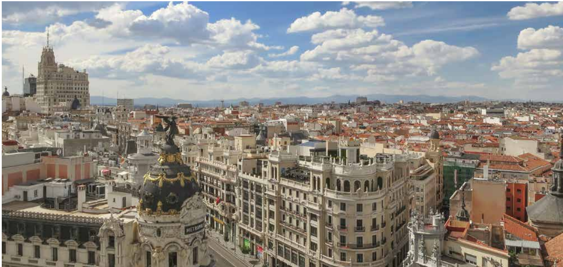
La Gran Vía en Madrid